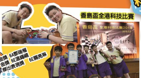
香島盃全港科技比賽