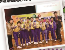
小五、小六代表隊獲得「葵葵青區小學數學遊蹤邀請賽2017」

本年度仁紀奧數隊共參加了約20項比賽，當中超過120名學生得獎，共獲得約400個獎項。