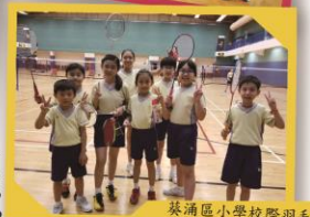
葵涌區小學校際羽毛球比賽女子團體季军