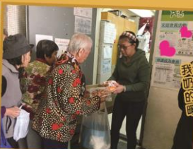
我們收集的食物，到了老師的手裡，看見她們的滿足的表情，心裏暖暖的……