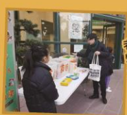
老師也來捐贈食物，支持我們的收集活動。