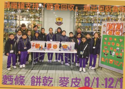
請繼續支持「節」食回收，捐出回收食物 麵條 餅乾 麥皮 8/1-12/1

CEO們在校內自發組織起來——「節」食回收計劃，呼籲老師同學們把麵條、餅乾、麥皮等食物捐贈出來，分享給有需要的人。並把眾籌的食物捐給了「民社中心」