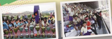
在葵涌區田徑比賽中，同學們勇奪多個獎項。

本校每年致力推廣體育活動，除了正規體育科課程外，亦透過校隊培訓、多元智能課和課餘興趣班，發掘和培養學生的運動潛能。一如以往，本校在葵涌區小學校際比賽中表現出色，分別奪得不同運動項目的獎項。乒乓球隊奪得男子團體比賽亞軍、女子團體比賽冠軍；田徑隊奪得男子乙組團體亞軍、女子乙組團體冠軍；此外，足球隊在公開比賽中表演突出，先後囊括五個足球比賽的冠軍，包括勇奪由香港足球總會舉辦的賽馬會五人足球盃(學校組) 分站冠軍。 除此之外，經過一整年的運動比賽後，本校再次贏得「全港小學體育獎勵計劃 - 葵涌區小學分會女子組金獎」(即葵涌區女子組全年總成績第一名)。