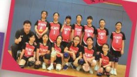
葵涌區小學校際乒乓球比賽女子團體冠軍及男子團體亞軍