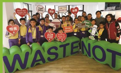
到粒粒皆辛館參觀,認識香港奇蹟問題,令我收穫甚多。