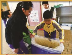
「吸嘴」我們的廚餘太多了！抬不動呀！