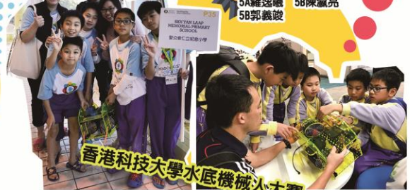
香港科技大學水底機械人大賽

「水底機械人大賽」本校參加了由香港科技大學主辦的《水底機械人大賽》，學生需親自動手製作水底機械人以完成各項水中任務。本校學生於比賽中獲得「銀章級」及「最佳設計獎」。