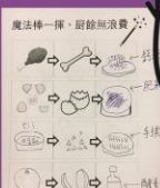
我們學習了「變廢為寶」。