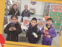
短短幾天，CEO們就籌備了這麼多的食物了！不要小瞧我們，雖然我們年紀小小，但我們有大大大的愛心呢！