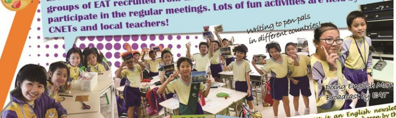
writing to pen-pals in different countries!

E.A.T. is the short form of English Ambassador Team. There are three groups of EAT recruited from three different levels. Students all actively participate in the regular meetings. Lots of fun activities are held by our CNETs and local teachers!