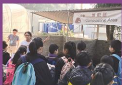
把廚餘變成肥料,有點不可思議。