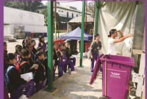
大型廚餘機,運作起來也很不容易呢!