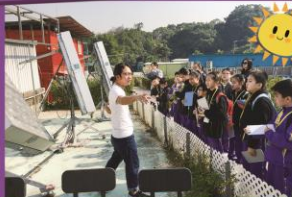
中心使用太陽能發電板,非常環保。