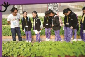
參觀環保菜園,綠地的一角。

資源中心內的「Re-Zone」是集回收、研發、農業、休閒及教育於一身的地方。每天收集大量酒店及商業機構製造出來的剩餘食物,進行回收處理。