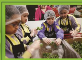
多謝望年婆婆和 Joey 姐姐的分享和講解。

CEO們參觀由惜食堂開設的全港首個提倡惜食及關愛的實體展館「粒粒皆辛館」,投入各項虛擬活動,感受基層家庭的生活實況。例如體驗居住房、拾紙皮和鋁罐等辛勞的工作外,也有機會與長者義工即場拯救食材、轉化廚餘。