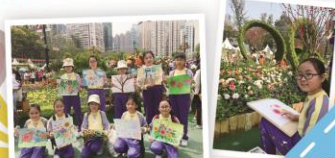
同學在「香港花卉展覽繪畫比賽」中大展身手，用心寫生。