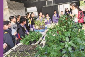
職員叔叔為我們講解不同的廚餘回收方法。